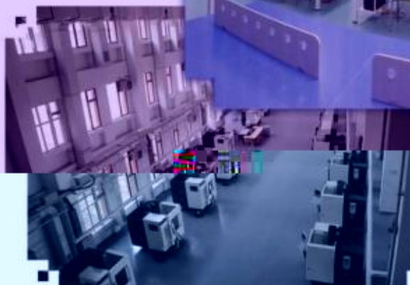
商贸管理类专业综合训练场所